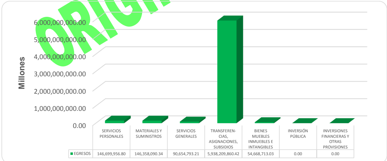
GRÁFICA 2 EGRESOS